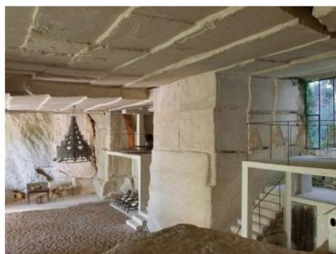
© Christopher Tubbs / Philippe Jonathan Maison Troglodyte à Bonnieux par Philippe Jonathan

Service documentation | 18/06/2013 | 14:34 | Réalisations