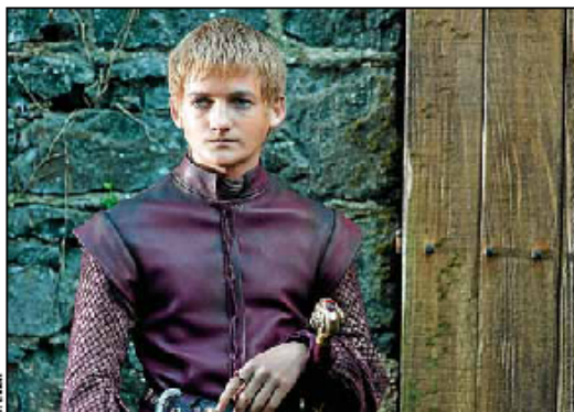
Le personnage de Jeffrey Baratheon permet d'aborder la morale.