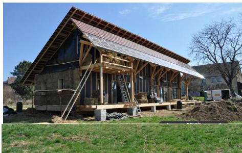
La maison de paille de l'atelier d'architecture Haha. — ATELIER D'ARCHITECTURE HAHA

Recommander 31 personnes le recommandent. Twitter +1