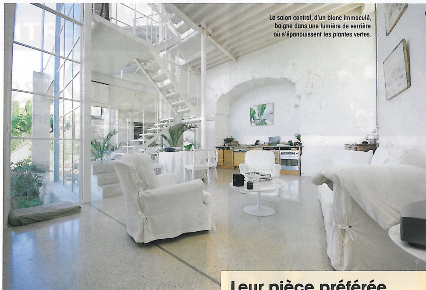
Le salon central, d'un blanc immaculé, baigne dans une lumière de verrière où s'épanouissent les plantes vertes.