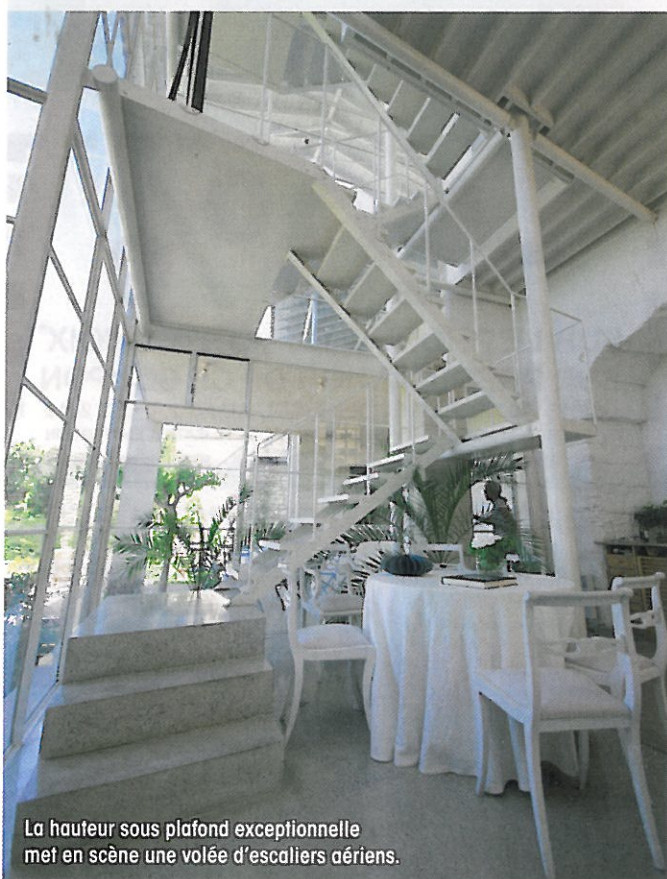
La hauteur sous plafond exceptionnelle met en scène une volée d'escaliers aériens.

Une pièce ? Pas vraiment, pas au sens strict en tout cas, dans cette maison où chaque espace joue sa partition en fonction des envies et des moments. Ce plateau de petites dimensions, posé entre ciel et terre, à la fois en balcon et en retrait par rapport au reste de la demeure, est le lieu de lecture privilégié, propice à la contemplation, aux dialogues, au silence. Le plafond bas, par contraste avec l'impression de hauteur qui domine ailleurs, renforce l'impression d'intimité. Des rayonnages, de beaux livres d'art, une table basse, un fauteuil près d'une ouverture vitrée où se chauffer le dos au soleil d'hiver, un canapé où prendre l'apéritif en contemplant la lumière du soir, et mille autres bonheurs de l'instant, que les propriétaires aiment à cultiver.