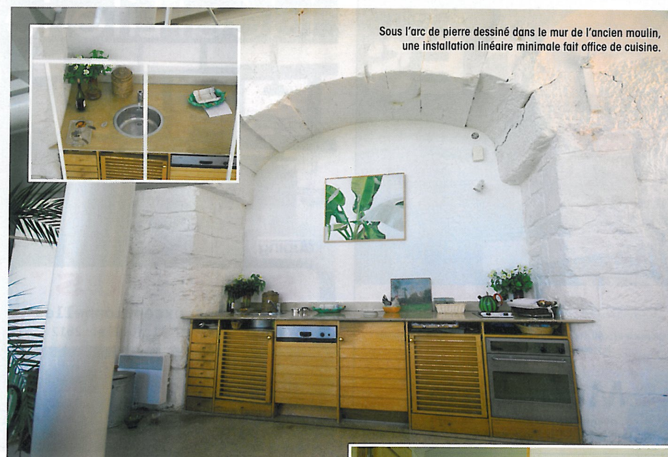
Sous l'arc de pierre dessiné dans le mur de l'ancien moulin, une installation linéaire minimale fait office de cuisine.

... des structures métalliques, protègent le tout.