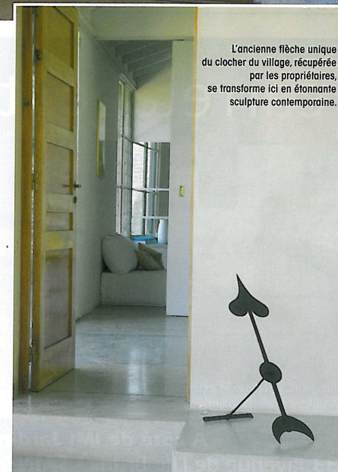
L'ancienne flèche unique du clocher du village, récupérée par les propriétaires, se transforme ici en étonnante sculpture contemporaine.